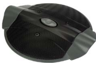
ClearOne Accumic PC

L'Accumic PC est un module audio idéal pour les salles de conférence incluant 3 microphones pour une couverture de 360 degrés. Contient un éliminateur d'écho et de bruit ambiant pour un son de qualité supérieure. ClearOne est un des chefs de file en matière de technologie audio professionnelle. Se connecte directement à l'ordinateur pour les conférences audio-vidéo de haute qualité sur le web.