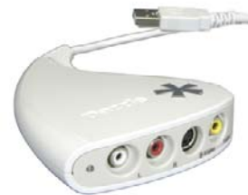
Pinnacle Dazzle DVD Recorder

Dazzle DVD Recorder constitue l'outil le plus rapide pour transférer le contenu de vos cassettes vidéo sur DVD. Cette carte de capture permet de transférer des vidéos sur un DVD via un PC.