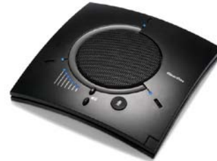
ClearOne Chat 150

Le téléphone haut-parleur personnel de CHAT™ 150 est un périphérique audio mobile qui se relie à une large variété de dispositifs et fournit des communications audio claires et sans écho en mains libres. Il fournit des possibilités duplex inégalées qui permettent à ses utilisateurs de parler et écouter simultanément sans coupage audio. Le CHAT™ 150 possède trois microphones permettant ainsi de capter les voix sur 360-degrés.