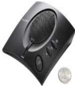
ClearOne Chat 50

Le téléphone haut-parleur personnel de CHAT™ 50 est un périphérique audio mobile qui se relie à une large variété de dispositifs et fournit des communications audio claires et sans écho en mains libres. Il fournit des possibilités duplex inégalées qui permettent à ses utilisateurs de parler et écouter simultanément sans coupage audio.